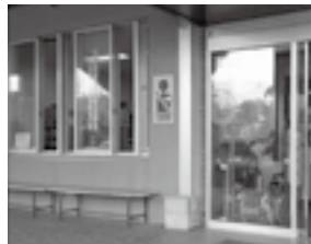
※写真は江釣子庁舎正面玄関

健康増進法第25条では、受動喫煙による健康への悪影響を排除するため、受動喫煙防止への取り組みを積極的に進めるよう規定しています。学校、病院、集会場、飲食店、宿泊施設、娯楽施設など、多くの人を利用する施設の管理者は、受動喫煙を防止するために必要な措置を講ずるよう努めなければならないと規定されています。