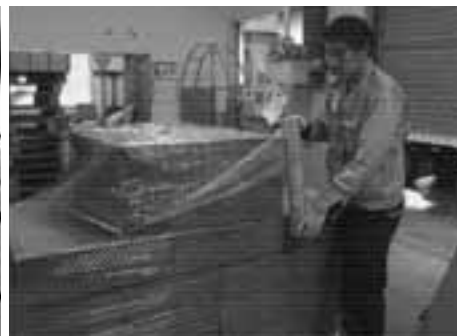
梱包作業をしています