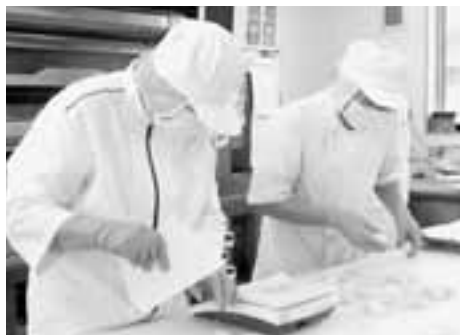
心を込めてパンを作っています