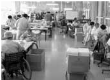
いろいろな作業をしています