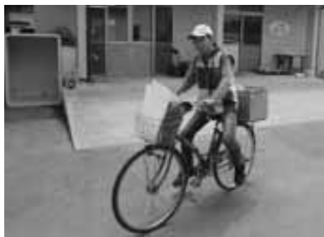
メール便行きま〜す！