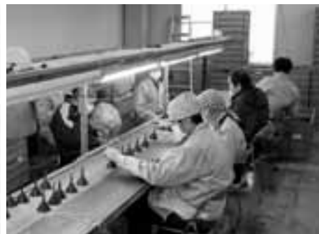
自動車部品の清掃をしています