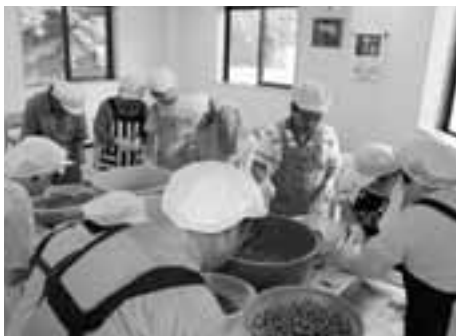
梅を加工しています