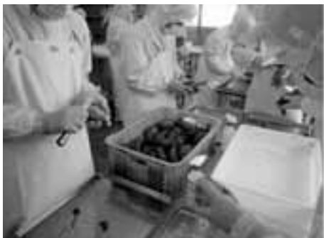
干しイモを作っています