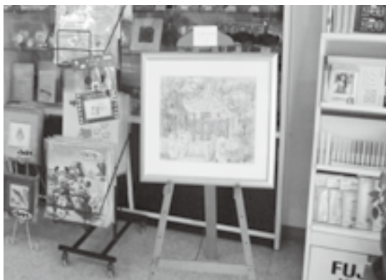
昨年度は24店舗に68点の作品が並びました