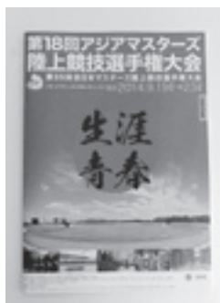
大会エントリーブック