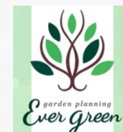
エバーグリーン のロゴマーク