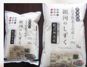
「銀河のしずく」無洗米