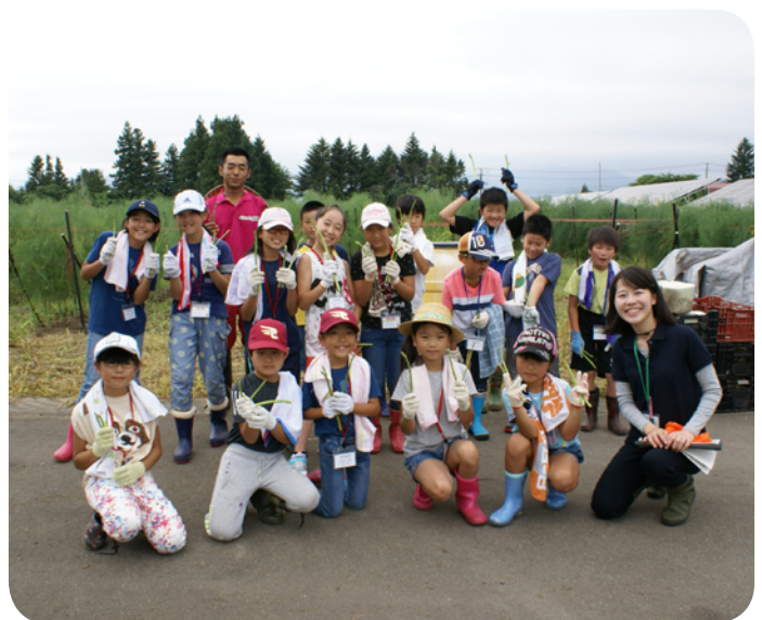
昨年度講座(収穫体験)に参加した塾生

はじめての人も、これまで受講したことのある人も、兄弟、姉妹、お友だちと一緒にの参加も大歓迎です!