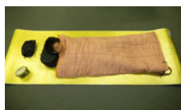
シュラフとキャンプマットの使用例