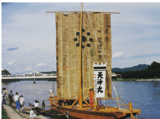
復元したひらた舟(昭和62年)