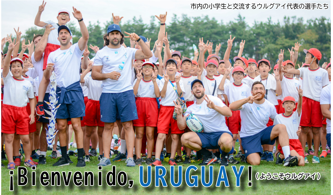
市内の小学生と交流するウルグアイ代表の選手たち

現在、国内各地で熱戦開催中のラグビー世界大会。北上市はウルグアイ代表チームの公認キャンプ地として、市民が一丸となりさまざまなおもてなし活動を行ってきました。今回はこれまでの取り組みを紹介します。