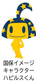
国保イメージキャラクターハピルスくん

修学のため市外に住所を置いていて、令和2年3月で卒業する人は、届け出が必要です。お持ちの学生用被保険者証の有効期限は3月末となっております。継続確認の調査書を3月下旬に郵送しますので、期日までに回答してください。