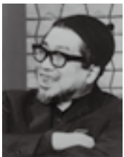
詩人サトウハチロー 1903(明治36)年生まれ、1973(昭和48)年没。日本で一番「おかあさん」の詩を書いたと言われる詩人。代表曲は「ちいさい秋みつけた」「リンゴの唄」「うれしいひなまつり」など。

■応募方法：次のいずれか①B4(またはA4)判400字詰原稿用紙2枚以内に縦書きし、応募票(コピー可)に