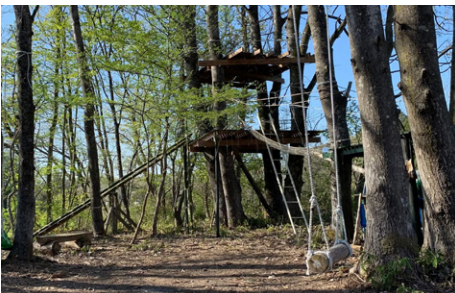
楽しさを自給する里山空間 口内秘密基地 認定番号:115 認定団体:口内秘密基地プロジェクト実行委員会