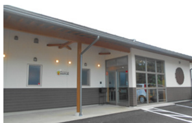
グループホームおおきな木、ほいくえんちいさな木