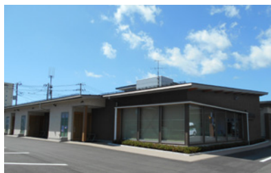
葬祭会館八重葬 博愛苑