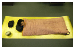
シュラフとキャンプマットの使用例