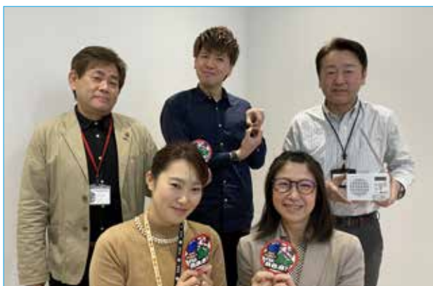
私たちパーソナリティーが、生活に役立つ情報などをお届けします！

皆さんこんにちは！きたかみE & Be (いいあんべ) エフエムです！北上市にお住まいの皆