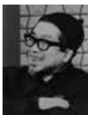
詩人サトウハチロー 1903（明治36）年生まれ、1973（昭和48）年没。日本で一番「おかあさん」の詩を書いたといわれる詩人。代表作は「ちいさい秋みつけた」「リンゴの唄」「うれしいひなまつり」など。

紙2枚以内に縦書きし、応募票を添付の上、郵送または持参②ホームページの応募フォームに必要事項を入力 【郵送先】〒024-0061北上駅前郵便局留め置き「おかあさんの詩」係 【持参先】生涯学習センター（大通り一丁目3-1）おでんせプラザぐらう（3階） ■問い合わせ：同コンクール実行委員会（生涯学習文化課内） ☎72-8304