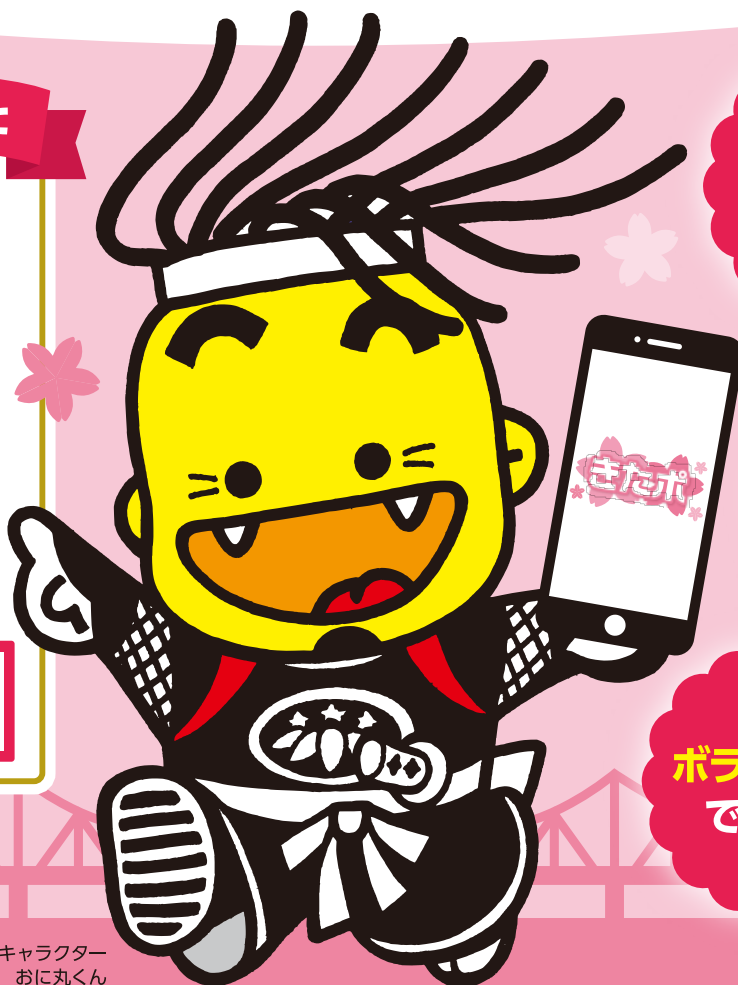
北上市観光キャラクター おに丸くん