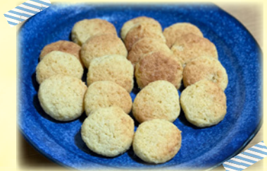
※今月は公立保育所で提供しているメニューです。