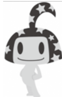
国保イメージキャラクター ハピルスくん

は3月末となっております。継続確認の調査書を3月下旬に郵送しますので、期日までに回答してください。令和5年3月に卒業する場合は調査書によりその旨回答してください。 ■問い合わせ：国保年金課 ☎72-8204