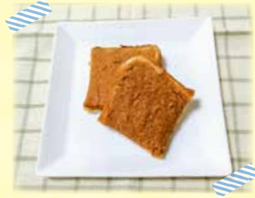
※今月は公立保育所で提供しているメニューです。