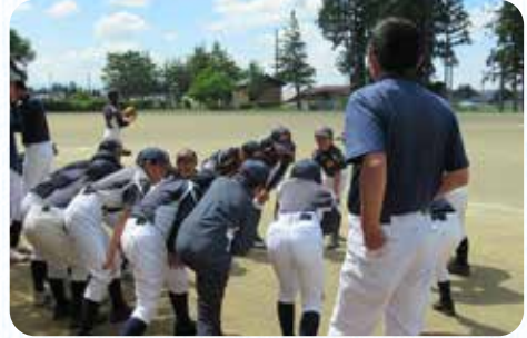
(上) スポ少に入団し野球を3年間続けてきた長男 (下) ボールを取れるようになり、ヒットも打てるように。子どもの成長が見られてうれしいです！