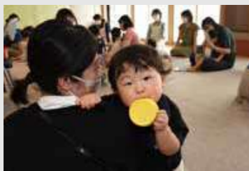
会場に設置したキッズルームで、お子さんと一緒に順番待ち