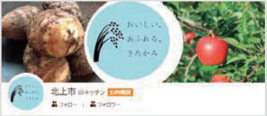
市公式クックパッド「北上市のキッチン」

市の管理栄養士お勧めの健康レシピや地産地消レシピ、郷土料理のほか、離乳食・幼児食レシピも掲載しています。調理のポイントや栄養素の解説もあるので、今日の献立決めの参考にぜひご覧ください！