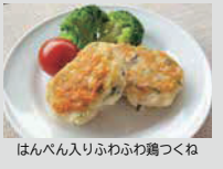
はんぺん入りふわふわ鶏つくね