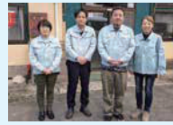
榎更木ふるさと興社 業委員会

養蚕業衰退により活用されなくなった更木地区内の桑園を活用するため、平成21年5月に地元農家数人が会社を設立。健康食品会社との業務提携により、桑茶の生産、加工、販売を始めました。現在は桑茶を中心に桑タブレット、桑麺などの独自商品開発も継続して行っており、地元産直をはじめ県内各地のスーパーや道の駅、自社オンラインストアでも販売をしています。