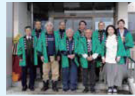
稲瀬町自治協議会 産業委員会

地元特産品のとうもろこしを使った加工品開発や銀河のしずくの試食販売、稲瀬町軽トラ市などを実施しています。令和5年度には花巻空港からの定期便を使った稲瀬町PR作戦「空飛ぶフードプロジェクト」で、朝採りとうもろこしや銀河のしずく新米の即売会を県外で実施するなど、地元の農作物を積極的に売り込む独自の活動を行っています。