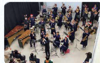
(上)さくらPORT・スクエアでアイロンビーズ作りを楽しむ子どもたち(下)飯豊中学校吹奏楽部がグリーンホールで演奏し、会場を盛り上げました