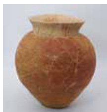
赤彩球胴甕 (立花南遺跡出土)