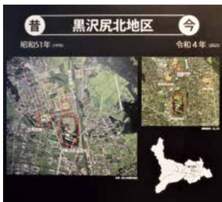
パネル一例（黒沢尻北地区）