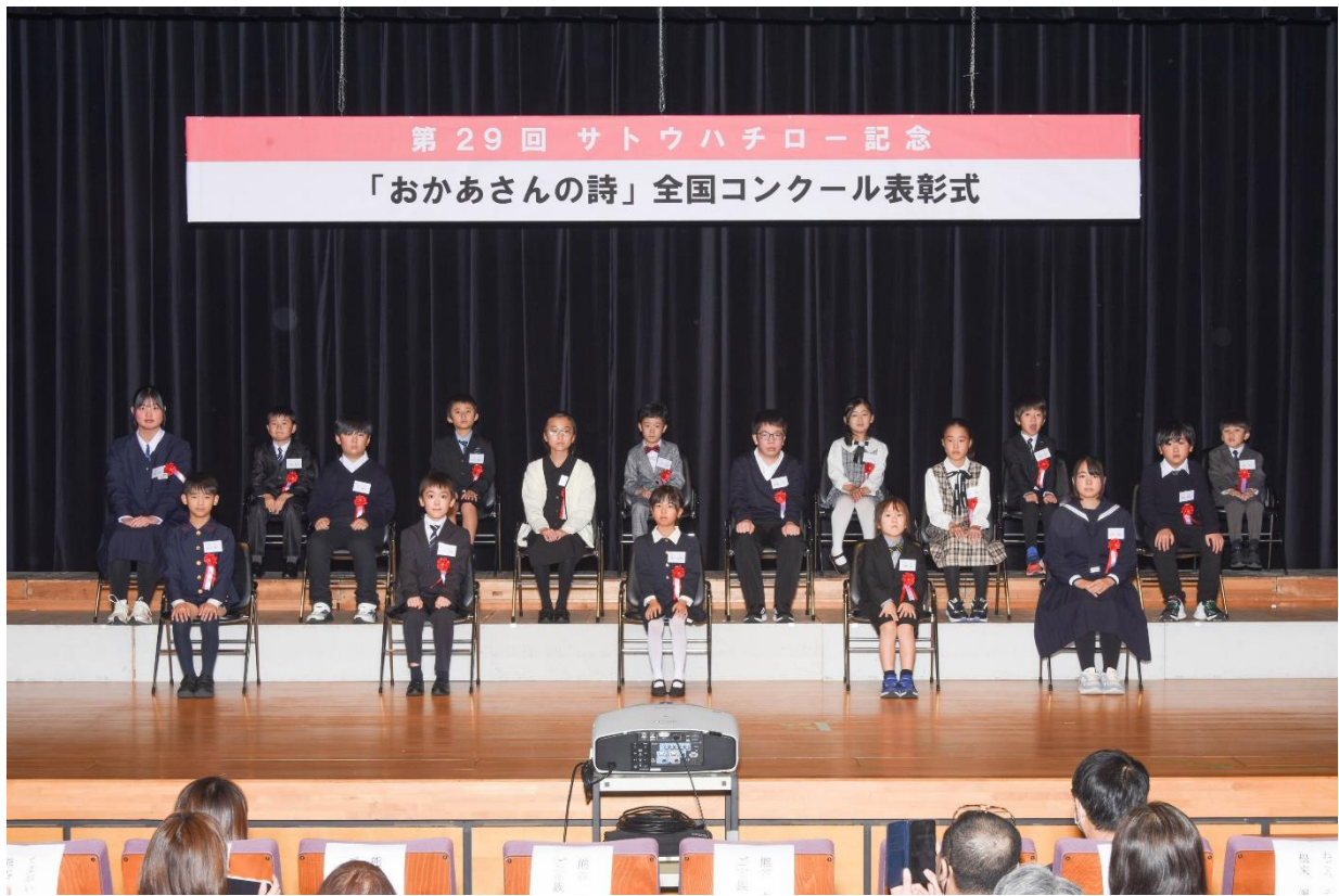
第29回コンクール 表彰式の様子