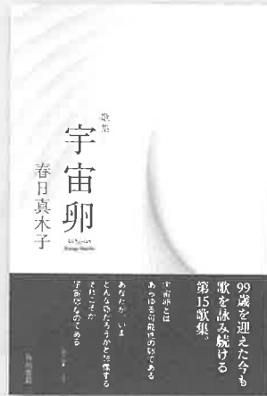
2025年9月 角川文化振興財団