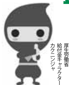
厚生労働省 給付金セクター カクーンジャ

両給付金ともに給付の対象と見込まれる人に、それぞれ6月27日(金)に申請書類を送付します。受給を希望する場合は、忘れずに申請してください。 なお、ご自身が給付対象者と見込まれる人で、7月10日(木)を過ぎても申請書類が届かない場合は、担当窓口までお問い合わせください。 ※受け取ることができるのはどちらか一つの給付金です。