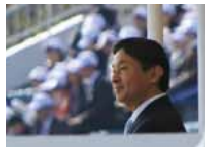
開会式をご覧になる皇太子殿下。入場行進の際は選手団を拍手で迎えられました