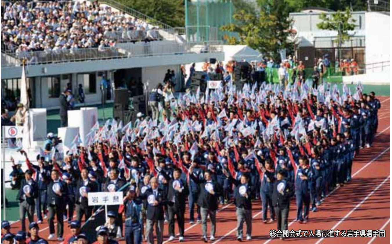
総合開会式で入場行進する岩手県選手団