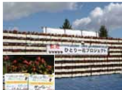
ひとり花プロジェクトで市民が育てたベゴニアのハンギングバスケット