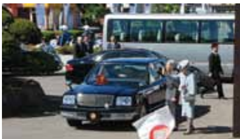
市役所本庁舎前で、集まった市民の声援にお応えになる天皇・皇后両陛下