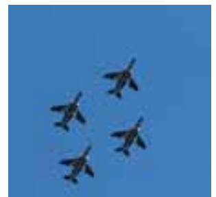
航空自衛隊ブルーインパルスによる展示飛行