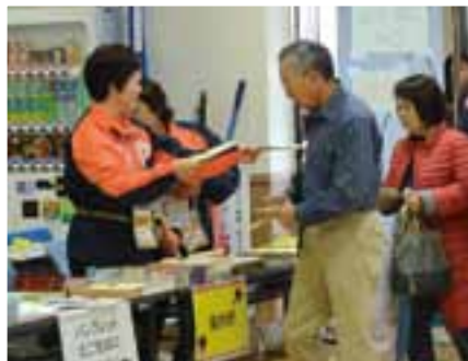
来場者にパンフレットを配る案内係