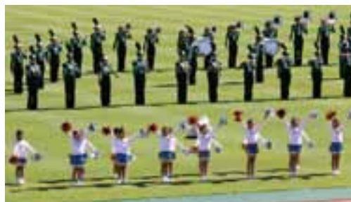
専修大学北上高校吹奏楽部と北上チアリーディングクラブDiamondsによるオープニングイベント