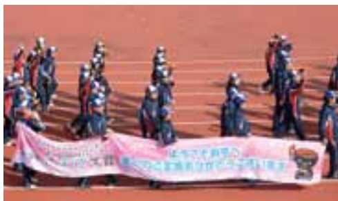
横断幕を持ち行進する岩手県選手団。東日本大震災への支援に感謝を表しました