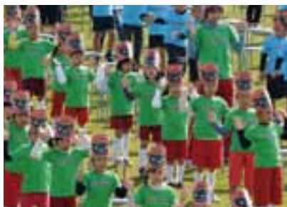
開会式前のオープニングイベントで「わんこダンス」を披露する市内の園児たち