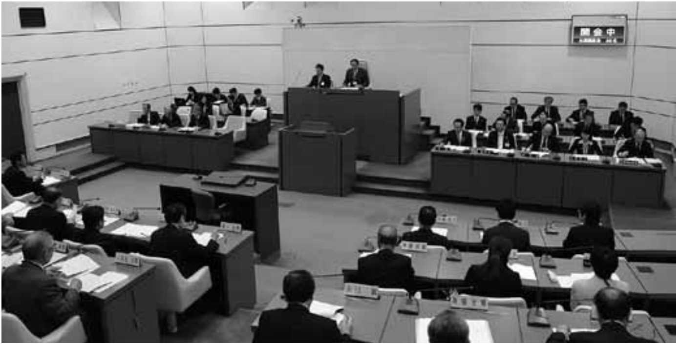
市議会議員改選後、初めて開催された臨時会議