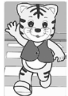
交通安全キャラクター「バトラくん」

※参加申込書兼委任状は、同協議会事務局で配布します。市のホームページからもダウンロードできます。