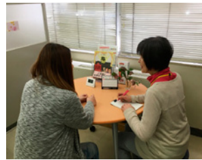
個別相談スペース

私を含む4人の相談員がどんな相談にも応じます。気軽にお越しになり、まずはご相談ください。