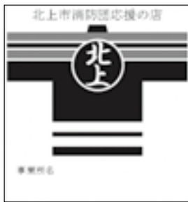
消防団応援の店表示証

※現在登録されている「応援の店」の一覧、登録届出書の様式は、市のホームページ( http://www.city.kitakami.iwate.jp/docs/2017111500068/ )に掲載しています。