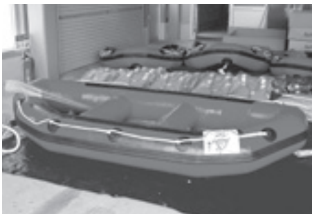
北上市消防団に配備された水害救助用ボート