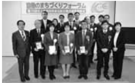
功績継続賞、功績賞、感謝状を贈られた企業の皆さん

協働のまちづくりフォーラム・第10回北上市地域貢献活動企業功績表彰式(北上市と市協働推進市民会議菊