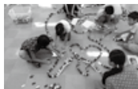
昨年度第4回講座「立てて倒してドミノでGO」

詳しい募集内容は、6月に学校を通じて配付するチラシに掲載します。参加をお待ちしています。