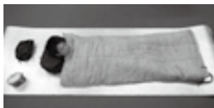
キャンプの必需品 シュラフとキャンプマット