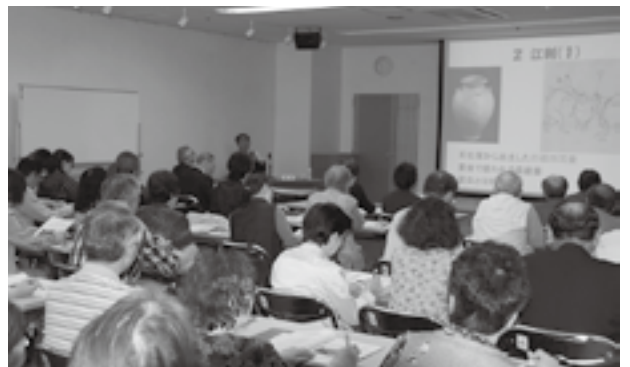
昨年度の北上市民大学