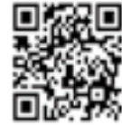
「こころの体温計」QRコード

携帯電話やパソコンを利用してストレスチェックできる「こころの体温計」に、ご自身の楽観度がわかる「こころのエンジン」モードを追加しました。