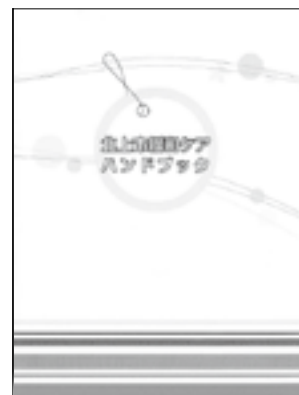
北上市緩和ケアハンドブック