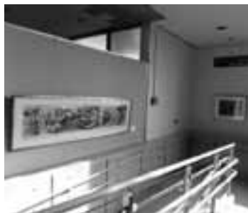
スロープギャラリーあんど

本庁舎1階の正面入り口と市民ロビーをつなぐスロープの壁面に、市所蔵美術作品を展示する「スロープギャラリーあんど」を開設しました。「あんど」の意味は、多くの皆さんに安心して利用していた、ただける優しいスロープであることから「安堵」でできることと、スロープを渡りながら、また、ロビーで休憩しながら芸術鑑賞ができる『&』を表しています。展示作品は、季節や時期に合わせて、定期的に入れ替えを行います。本庁舎にお越しの際は、ぜひ気軽に美術作品をご鑑賞ください。