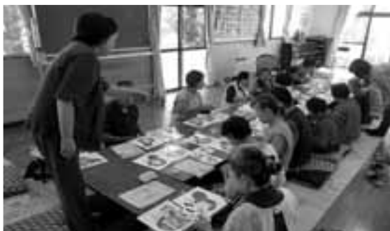
昨年度口内1区公民館で行われた和紙ちぎり絵(講座No.185)

新メニューを随時追加して実施している出前講座。28年度は、16の講座が増え、充実したメニューとなっています。その中から、抜粋して紹介します(右表)。 子ども会や自治会、職場の勉強会など、新たな学びや発見をしてみませんか。皆さんからの注文をお待ちしています。