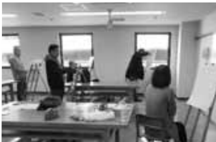
木炭デッサンをする受講生