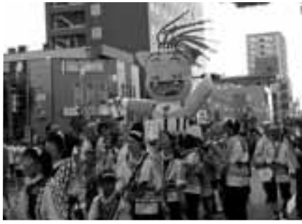
昨年市長賞を受賞した黒沢尻11区さくら子ども会