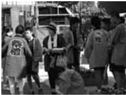
おまつり広場で会場の準備を進める学生ボランティア

※遠方の団体には、みこしの運搬や参加者の送迎などの手伝いが可能です。詳細はご相談ください。