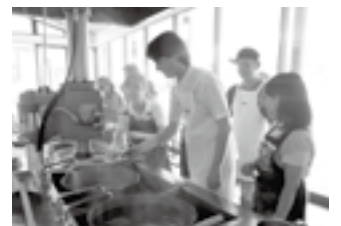
昨年の冷麺作り体験