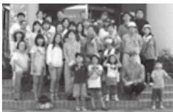
昨年のフィールド・トリップに参加した皆さん。ガーデニングのヒントを学びました

国際交流ルーム恒例行事の一つ「フィールド・トリップ(外国人と楽しむ体験学習バスツアー)」は今年15回目を迎え、7月10日(日)、アストロ・ロマン大東で「そば打ち」&「バウムクーヘン作り」にチャレンジします。そばは室根高原の二八そば、バウムクーヘン(樹木の年輪のようなケーキ)は生地から本格的に作ります。根気よく回転させて焦げないようにするのがコツだそうです。