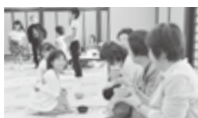
お茶の作法を学んだ子どもたちによるお茶会(黒沢尻西地区文化祭)

地域の文化祭や運動会で、子どもが地域の一員として活躍する姿が見られます。運動会では子どもがボランティアとして運営に関わったり、文化祭ではステージ発表を行ったりしています。地域活動の中で子どもの出番を多く作り、経験を積ませていくことが子どもの成長につながっています。