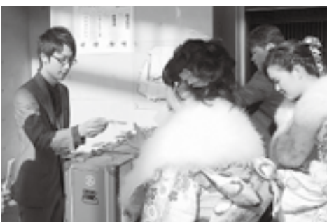
模擬投票で新成人に投票用紙を配布するボランティアスタッフ

●募集人数:20人程度 ●申し込み:11月25日(水)までに住所、氏名(ふりがな)、生年月日、電話番号を電子メール(seijin@kitakami-manabi.jp)成人式応募専用)または電話(☎72-8303)で生涯学習係へ ●その他:ボランティアスタッフも時間通りに式典に出席することができます