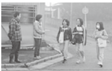
和賀地区青少年健全育成会が行う地域ぐるみのあいさつ運動

また、家の周りや散歩の途中で「おはよう」「おかえり」など子どもに声をかけることも、大切な見守り活動であり、地域の教育力高める行動です。