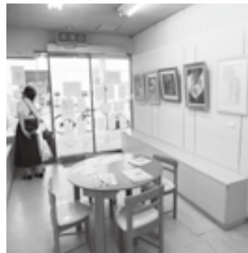
「まちなか学校」での展示