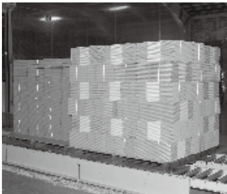
外側への印刷や折り目などの加工を行い、出荷しやすいように梱包した段ボール製品

リサイクルに優れ、環境に優しい段ボール。既製品がないため、岩手森紙業株式会社では、完全オーダーメイドで受注から納品までを行っています。厚さは大きく分けると3mm、5mm、8mmの3種類。中に入れる商品の重さと、運ぶ距離に応じて使用する紙の厚さを変え、強度を調整しています。また、水分を含むものを入れる箱には内側に撥水効果のある素材を塗ったり、野菜などを入れる組み立て式の箱は組み立てやすいように折り目を入れるなどの加工を行っています。