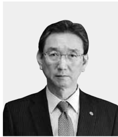
副市長 及川 義明