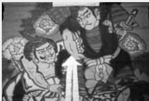
大口に描かれた安倍貞任・正任