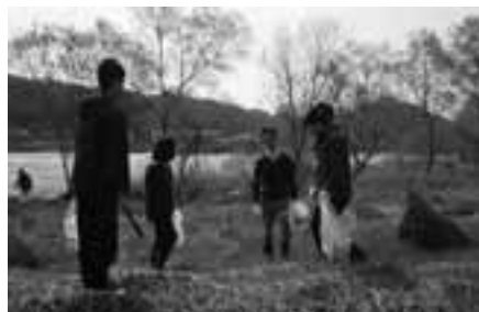
【東北電力株式会社花北営業所】北上川河川敷清掃活動