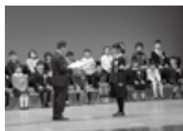
表彰を受ける児童たち