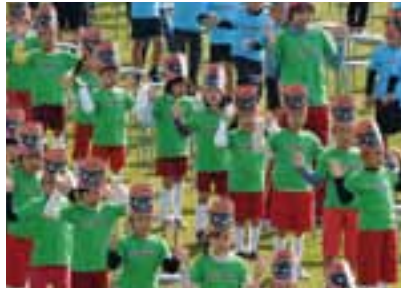
開会式前のオープニングイベントで「わんこダンス」を披露する市内の園児たち