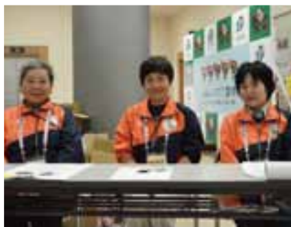
選手や関係者を笑顔で迎えました