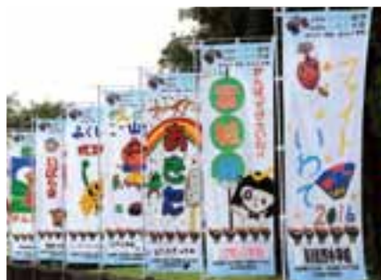
競技会場に飾られた応援のぼり旗