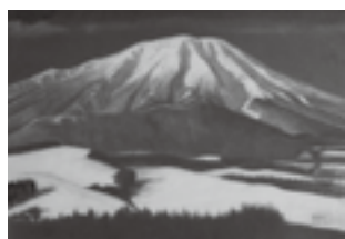
三人展で展示している「岩手山」(高橋大八作)