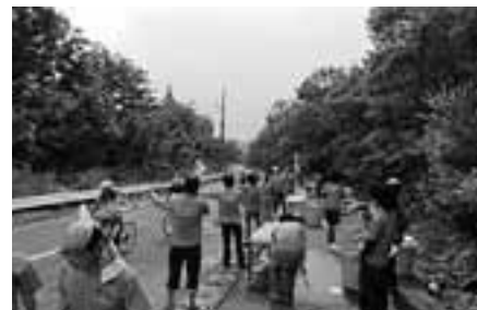
【パンチ工業株式会社北上工場】きたかみ夏油高原ヒルクライム給水所ボランティア