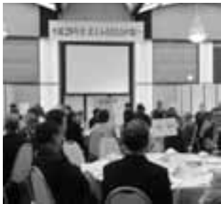
大勢の参加者でにぎわった、北上ふるさと会の集い

160人を超える参加者が北上おでんせを踊るなど会場はふるさとの空気に包まれました。