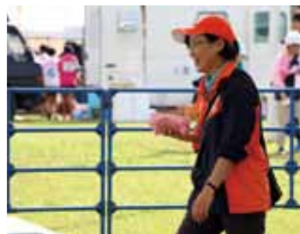
休憩所の清掃をするおもてなし係