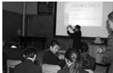
【北上信用金庫】しんきんマネースクール