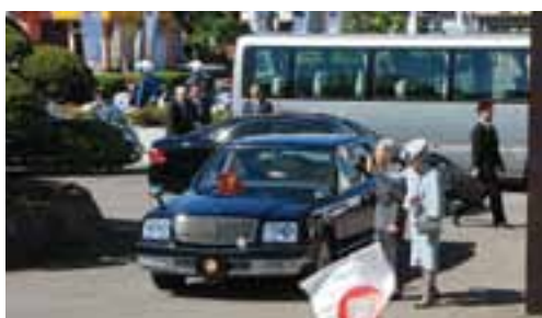
市役所本庁舎前で、集まった市民の声援にお応えになる天皇・皇后両陛下