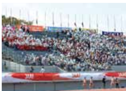
陸上競技の選手を応援する観客