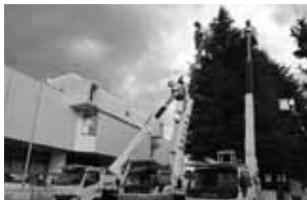
【北上地区電気工事業協同組合】リボンシャワー事業