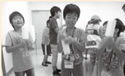
ペットボトルに生クリームを入れて振りバターを作る塾生

「ものづくり工場見学～牛乳からなにができるかな?」の講座では牛乳の製造工場を見学した後、バター作りを体験しました。子どもたちはものづくりの難しさ、楽しさを学んだ様子でした。