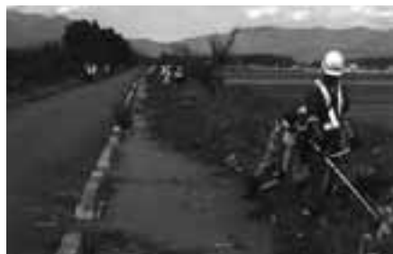
【有限会社新江建設】草刈り・除草活動