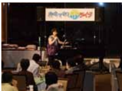
市内ホテルなどで開催された「おもてなし街ライブ」

ひとり花プロジェクト、都道府県応援のぼり旗の設置など、市を訪れる皆さんに楽しんでもらえるよう、市民一丸となってさまざまな「おもてなし」を実施しました。