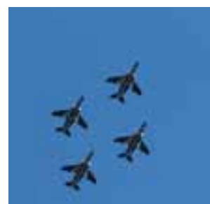
航空自衛隊ブルーインパルスによる展示飛行