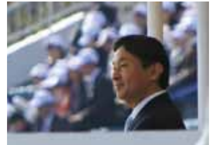
開会式をご覧になる皇太子殿下。入場行進の際は選手団を拍手で迎えられました