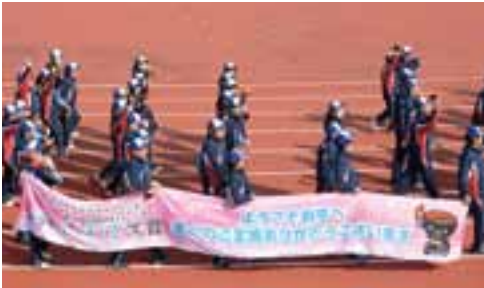
横断幕を持ち行進する岩手県選手団。東日本大震災への支援に感謝を表しました