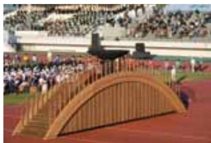
国体・大会期間中灯された炬火は閉会式で納火されました