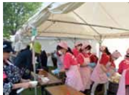
各競技会場での芋の子汁などの振る舞い