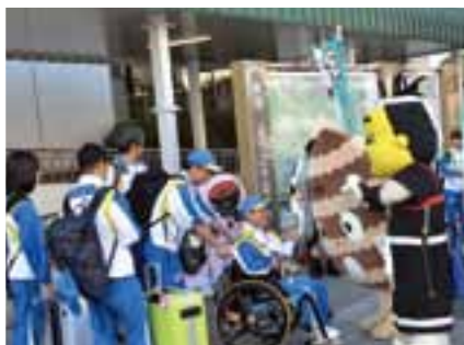
JR北上駅に到着した選手団の出迎え