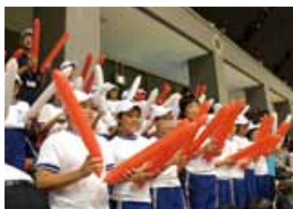
バドミントン会場で選手を応援する更木小学校の児童たち