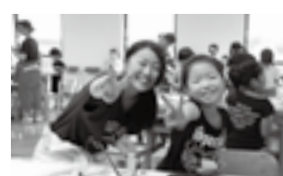
高校生が優しく教えてくれます

高校生のお姉さんと一緒に、楽しくアート作品を作ります。今回は絵本の読み聞かせを通してイメージした紙の「ミニクリスマスツリー」作りに挑戦!冬にぴったりな作品と一緒に作ってみませんか。