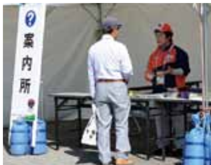
来場者に運動公園内を案内する案内所係

約1,400人の市民がボランティアとして参加。会場の案内や環境美化などに携わり、国体・大会の運営を支えました。