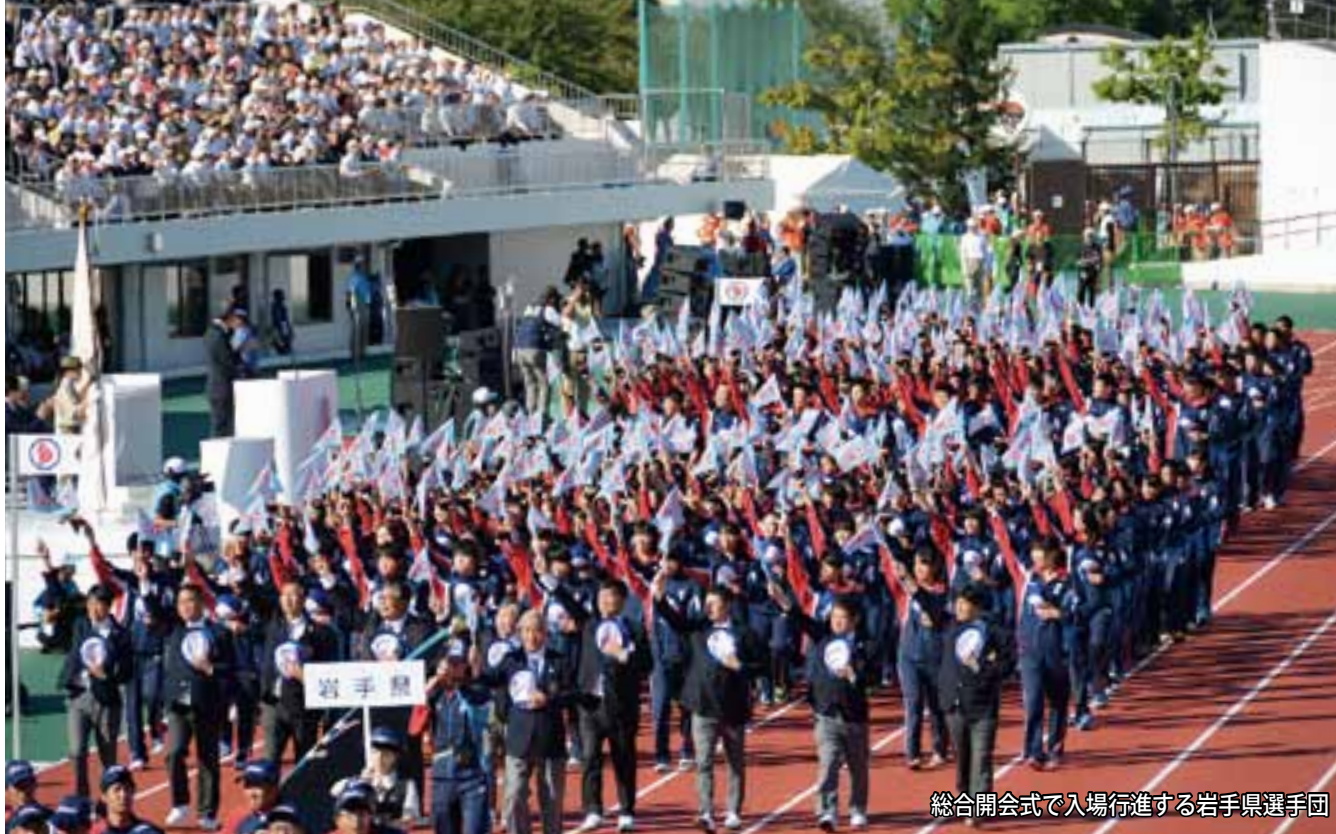
総合開会式で入場行進する岩手県選手団