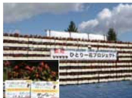
ひとり花プロジェクトで市民が育てたベゴニアのハンギングバスケット