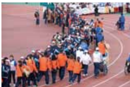
閉会式後に、退場する各都道府県・政令指定都市選手団を見送る岩手県選手団