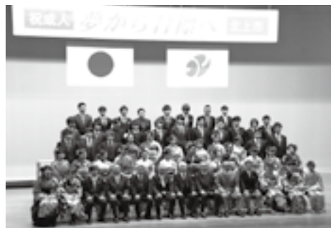
昨年の北上市成人式