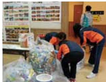
会場のごみをまとめる環境美化係