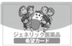
ジェネリック医薬品希望カード

医療機関や薬局でジェネ リック医薬品を希望する意思 を伝えるには「ジェネ リック医薬品希望カード」 をご利用ください。カードは 国保年金課、江釣子・和賀民 生係の窓 口で配布 していま す。希望 する人は 気軽に 申し出 ください。