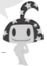
国保イメージキャラクター ハビルスくん