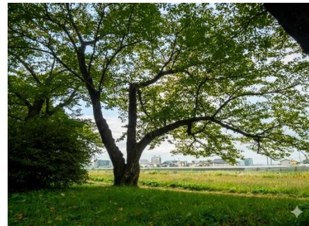
令和7年 樹勢（良） 緑の濃い大きな葉がついた