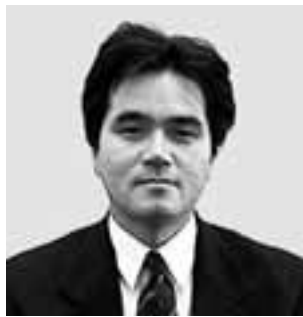
生活環境部長 松岡 裕