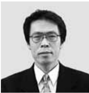
農林部長 高橋 善孝