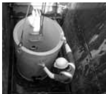
下水道マンホール設置工事