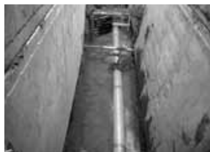
下水道管路布設工事