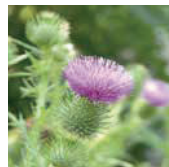
アメリカオニアザミ