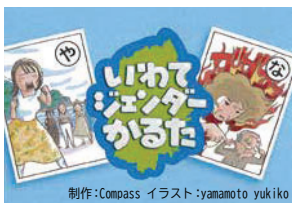
制作:Compass イラスト:yamamoto yukiko