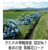
きたかみ景観資産 認定No.1 垂井の里 紫陽花ロード