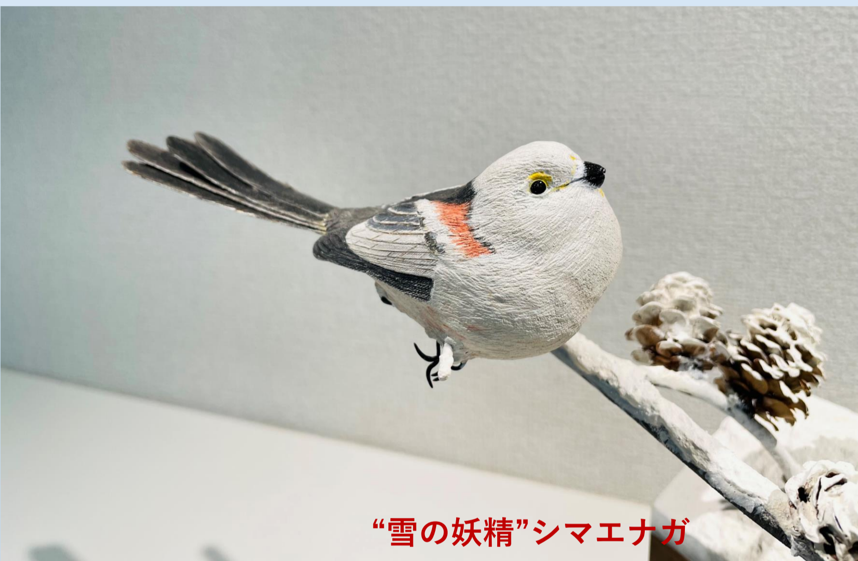
“雪の妖精”シマエナガ