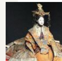
黒沢尻の大雛人形