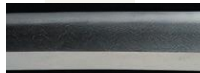
月山古刀の鍛え 綾杉形