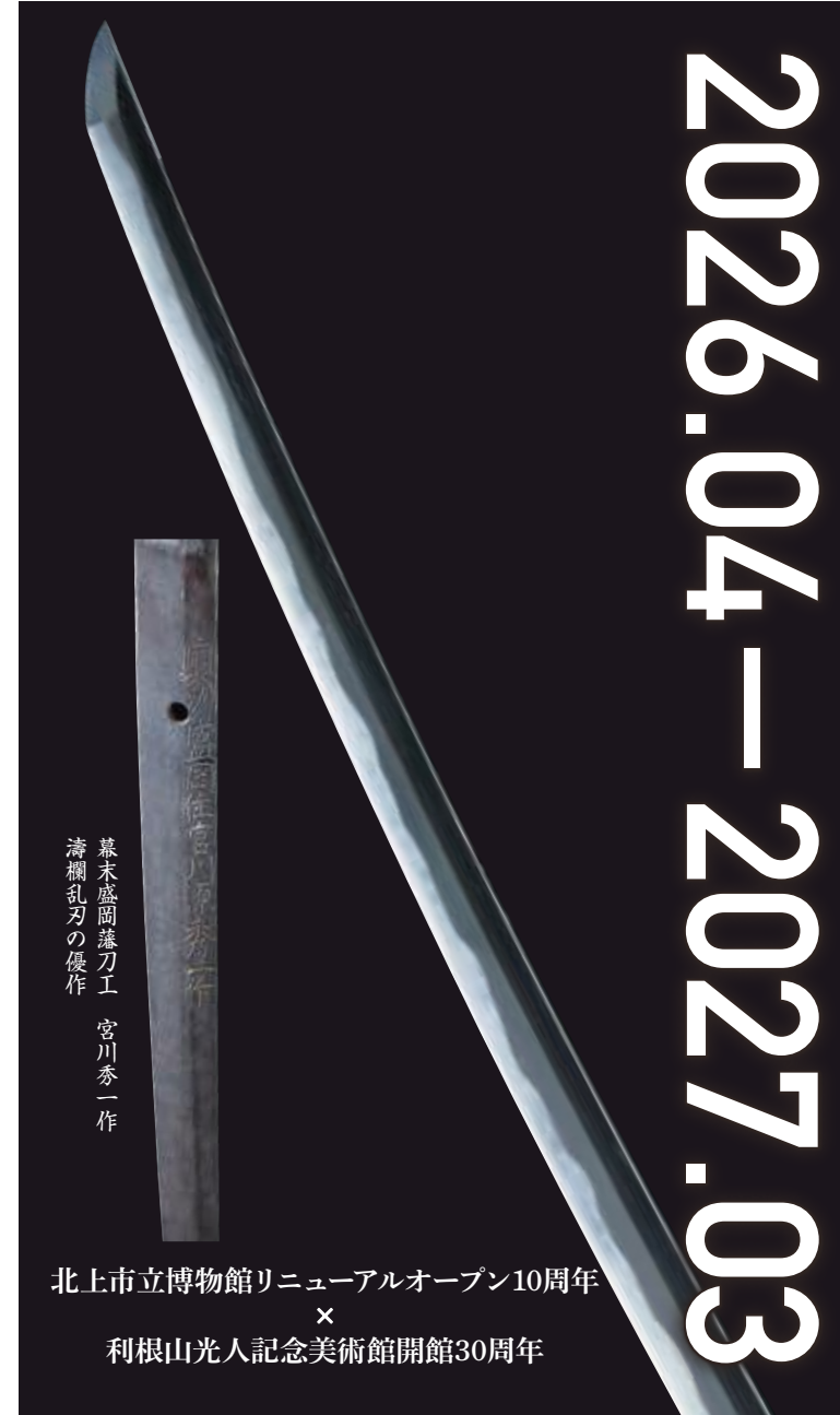
幕末盛岡藩刀工 宮川秀一作 濤欄乱刃の優作

北上市立博物館リニューアルオープン10周年 × 利根山光人記念美術館開館30周年