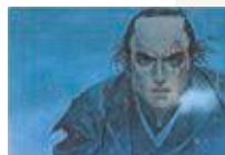
© Jiro Asada Takumi Nagayasu/HOMESHA 漫画「壬生義士伝」より