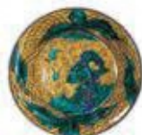
青手古九谷大皿 (17世紀)