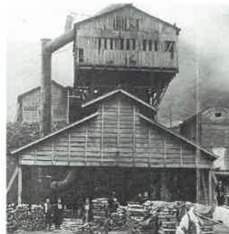
仙人製鉄所12トン高炉