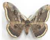
オオクジャクヤママユ